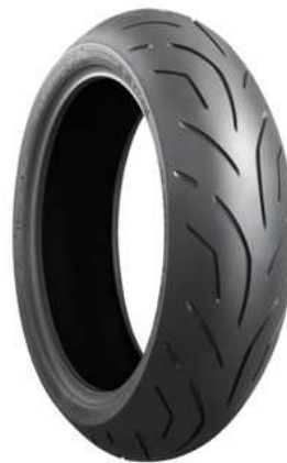
Battlax S20 Rear

Bridgestone verstärkt seine Motorradreifenpalette mit der Vorstellung des neuen Battlax S20. Der Reifen wurde speziell für Supersport-Motorräder mit einem Hubraum von 600 bis 1300 ccm entwickelt. Der S20 (das "S" steht für Sport) komplettiert die Hyper Sport Linie, zu der auch der BT 016 Pro sowie der BT 016 gehören.