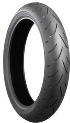
Battlax S20 Front